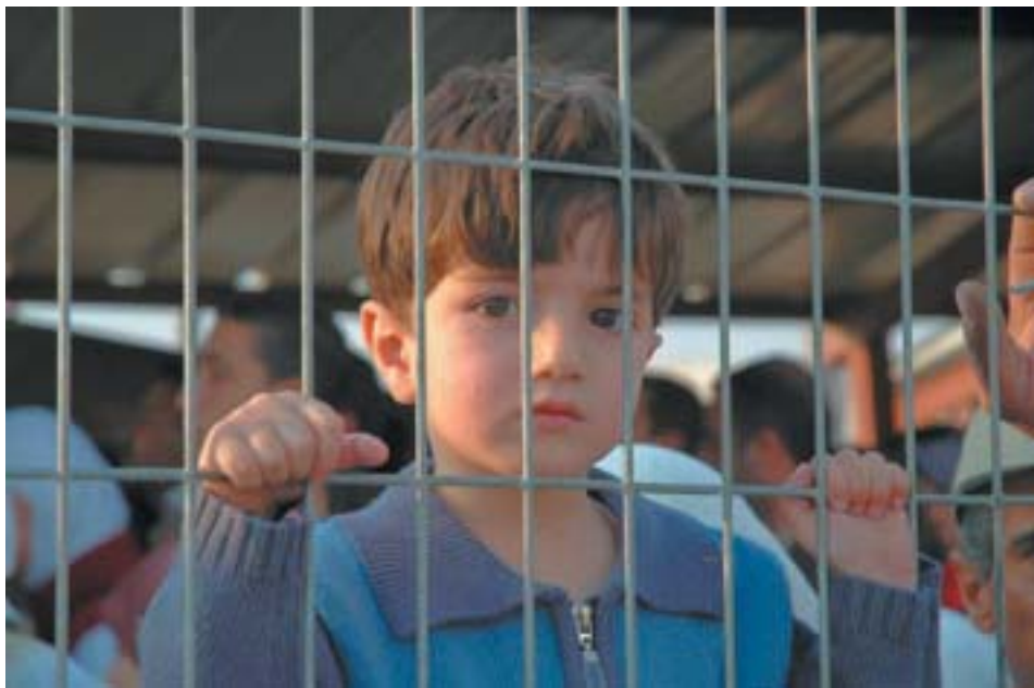
מאחורי הסורגים במחסום קלנדיה