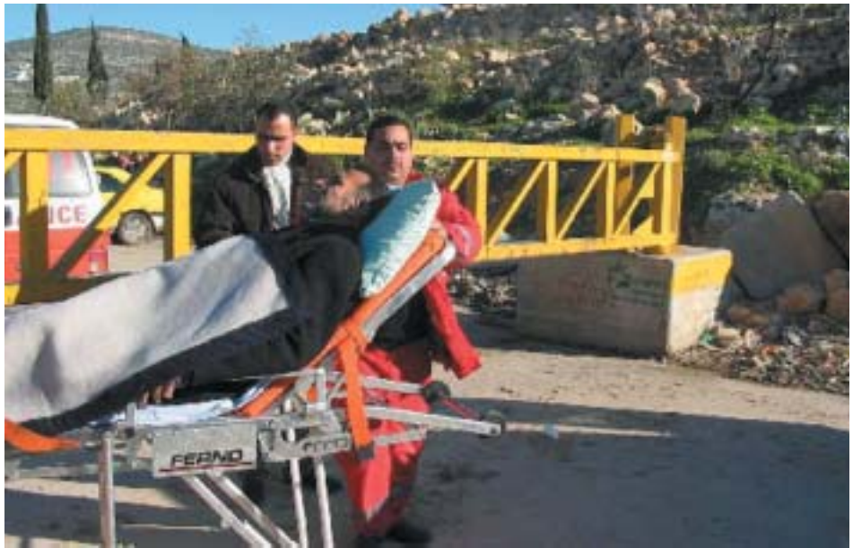
השער הסגור תמיד בענבתא. כדי להגיע לאמבולנס, החולה יאלץ לעבור מתחת לשער.